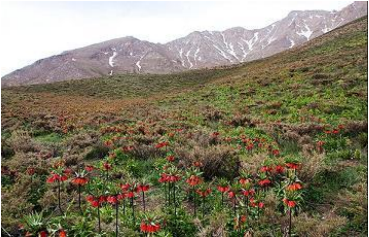
دشت لاله ها