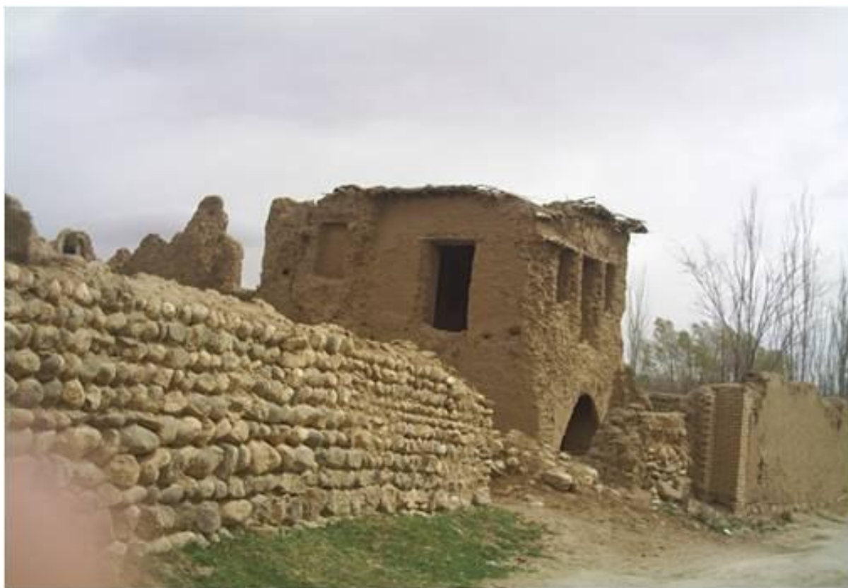
خانه های قدیمی مخروب شده در روستا